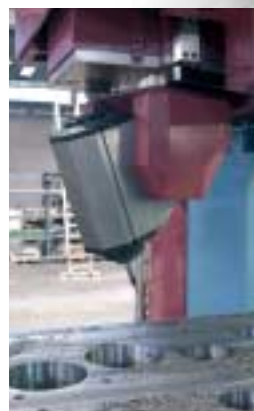
Testa universale birotativa TMX con elettromandrino