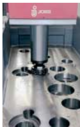
Testa di fresatura/alesatura a 3 assi con diametro esterno 200 mm