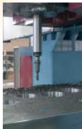
Testa di fresatura/alesatura a 3 assi con diametro esterno 100 mm