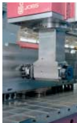
Testa a squadra